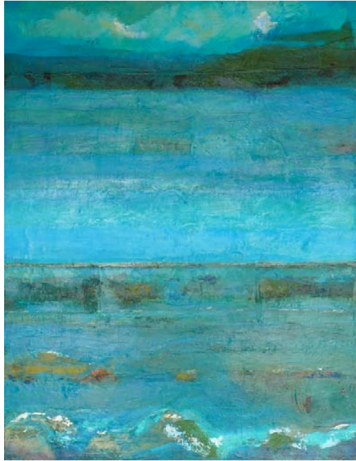
Carmen Nicolás Gómez con la obra: Arrecife 89 x 116 cm - Precio de venta 950 €