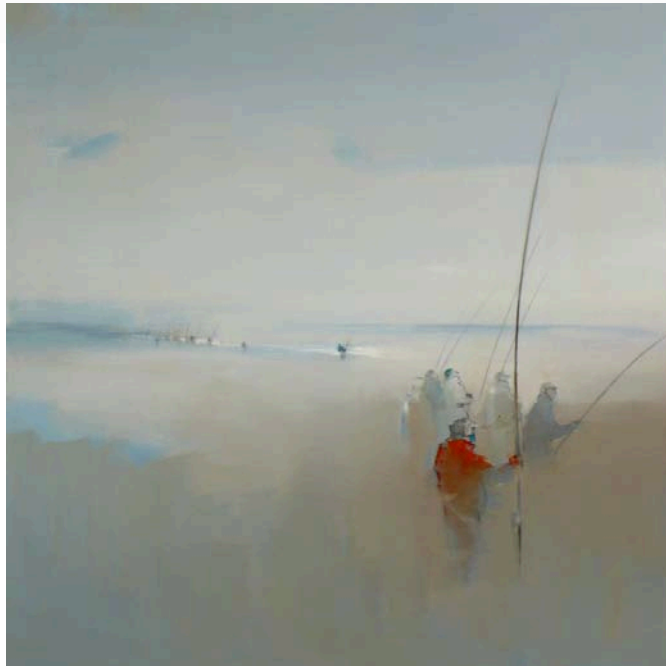
Josep Plaja López con la obra: Pescadors de platja 120 x 120 cm - Precio de venta 1.000 €