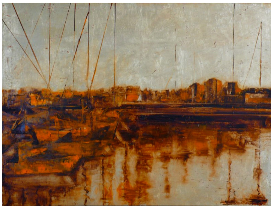
Victoria Ramírez con la obra: Reflejos del mar 80 x 60 cm - Precio de venta 1.200 €