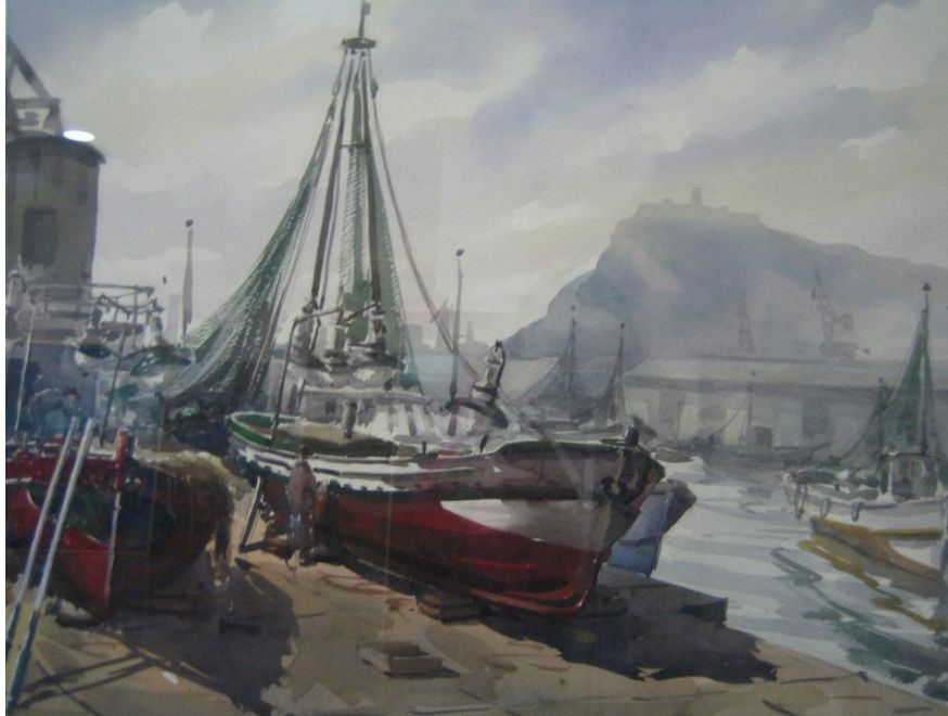
Manel Berbía Calpe con la obra: Port de Barcelona 73 x 54 cm - Precio de venta 1.200 €