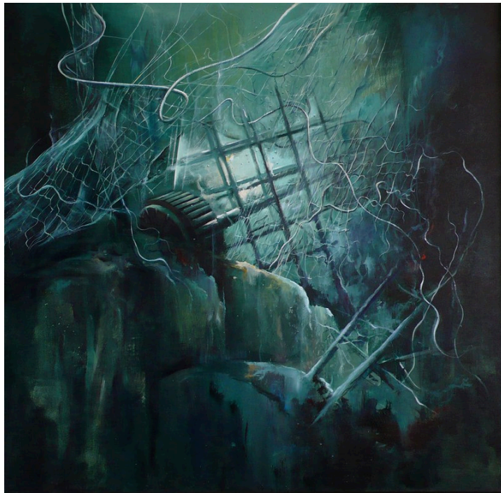
Joan R Espax Dolade con la obra: Deixalles a la mar 114 x 116 cm - Precio de venta 1.500 €