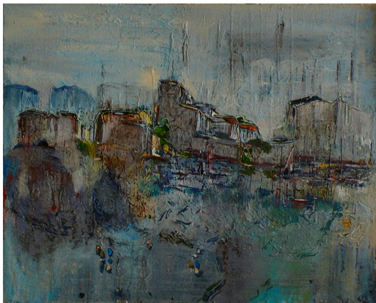
Carme Tort Tañà con la obra: Mediterrani 30 Figura - Precio de venta 1.200 €