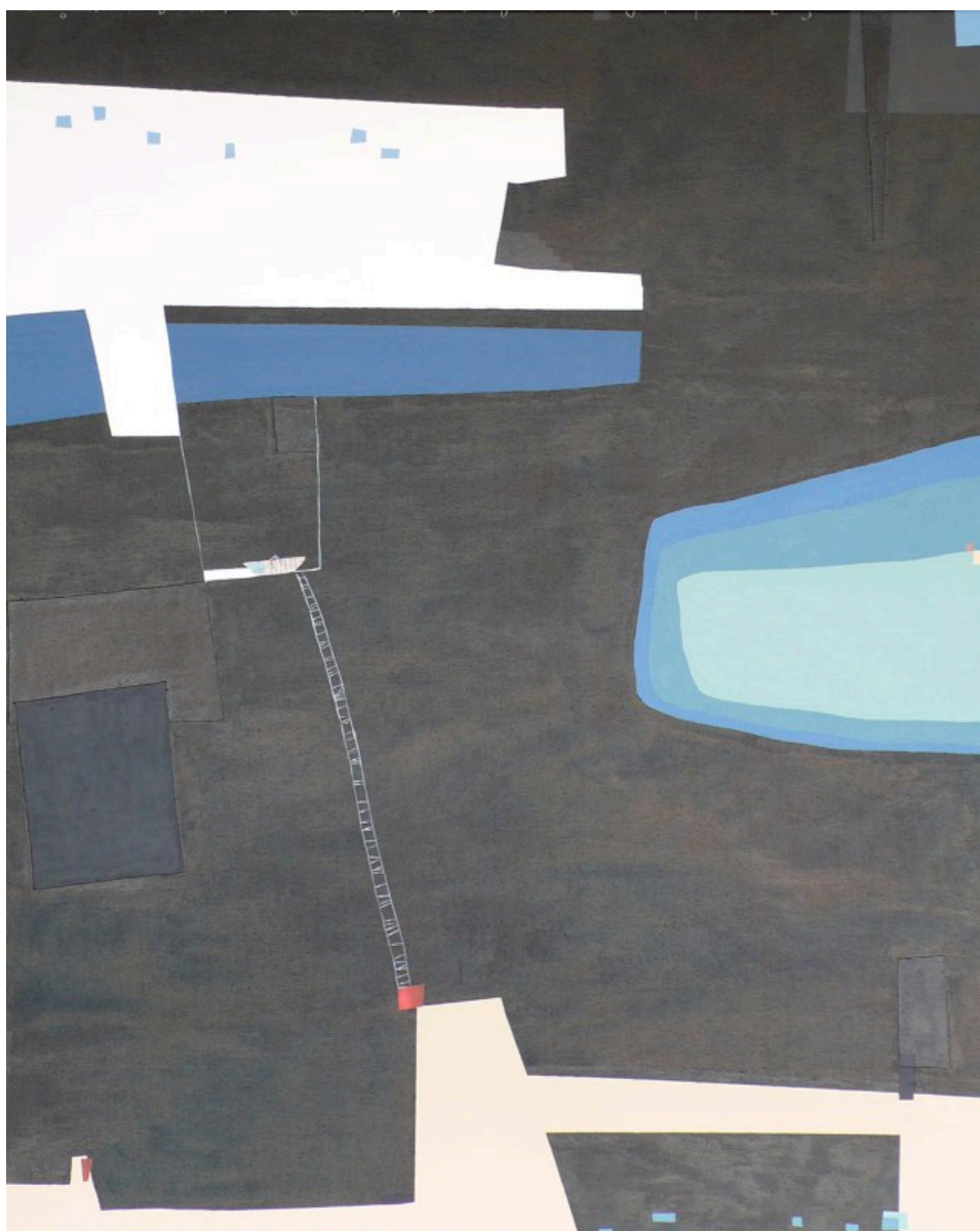
Lídia Antonio Trobat con la obra: Notícies mar enllà 100 x 81 cm - Precio de venta 600 €