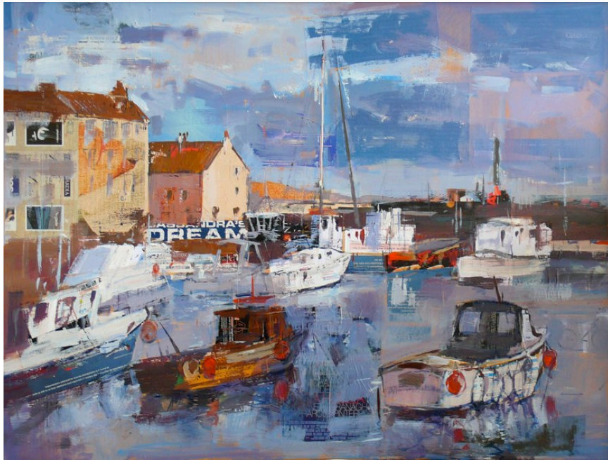
Ernest Descals Pujol con la obra: Port 130 x 97 cm - Precio de venta 2.500 €