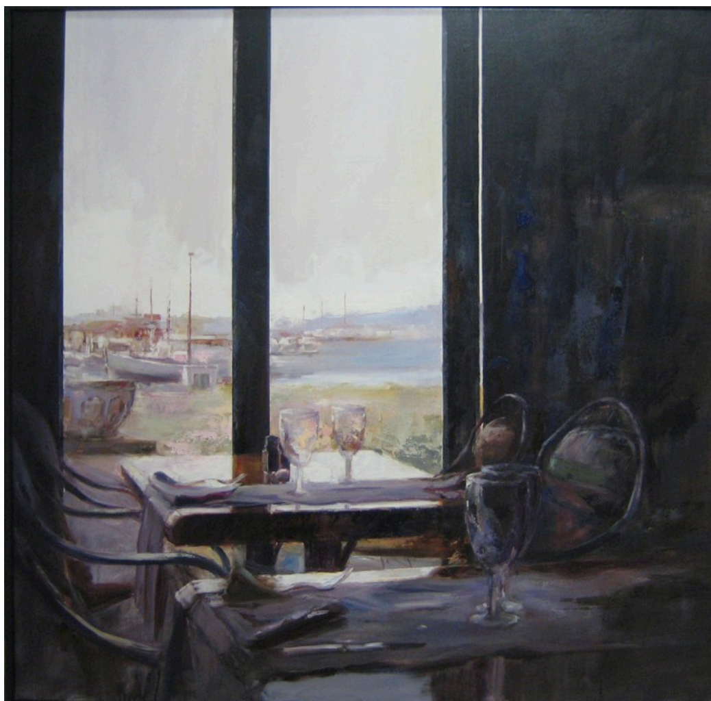
Joan Josep Catalá Paysán: Sabor a Mar 116 x 114 cm - Precio de venta 1.800 €