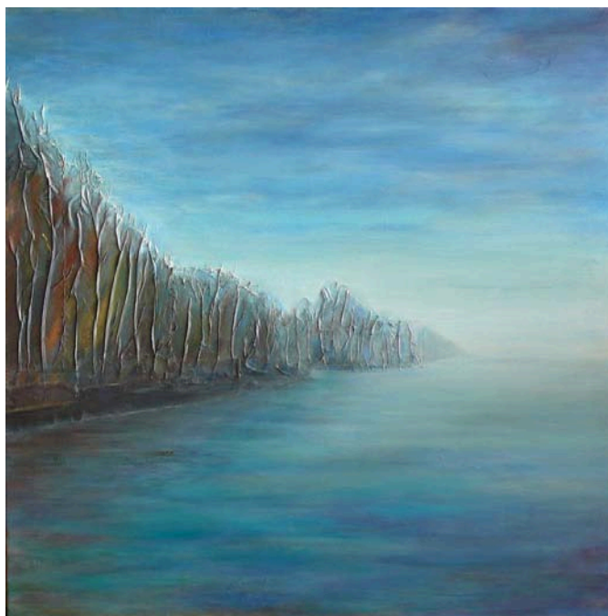
Piedad Alós del Pozo con la obra: Blau serè 100 x 100 cm - Precio de venta 890 €