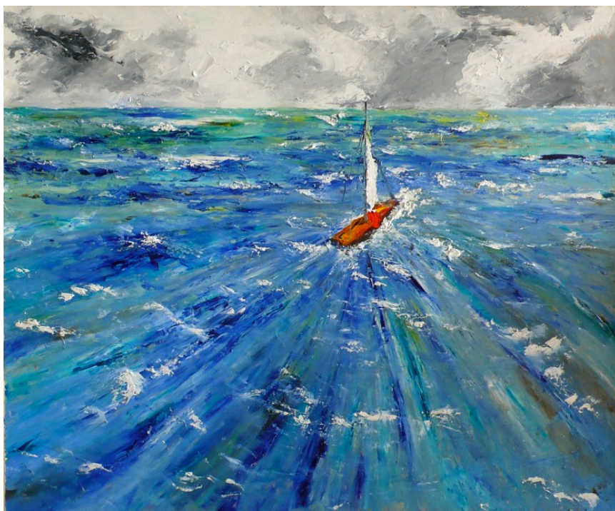
Gustavo Gómez Alonso con la obra: Ahora con tormenta 100 x 122 cm - Precio de venta 1.800 €