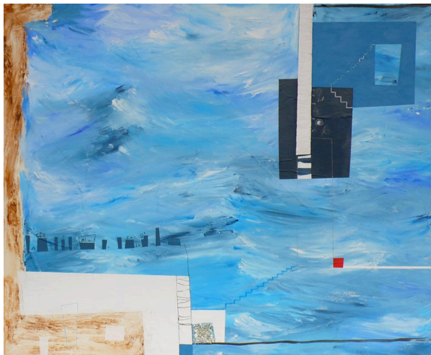
Lídia Antonio Trobat con la obra: Accents de Blau 73 x 60 cm - Precio de venta 480 €